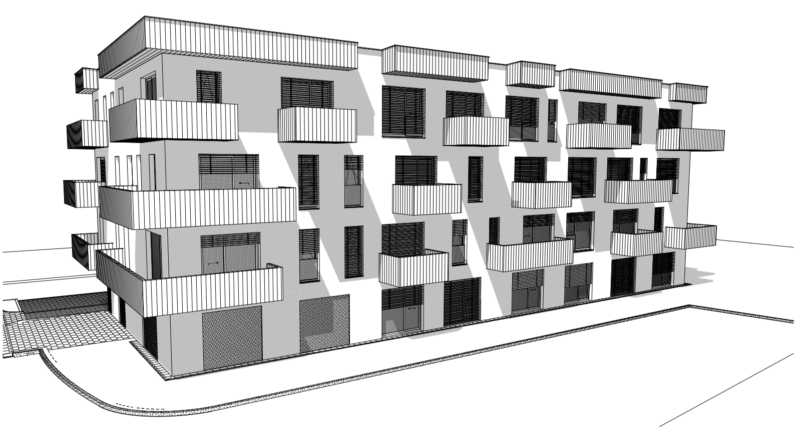
SCHÉMA 1: 750